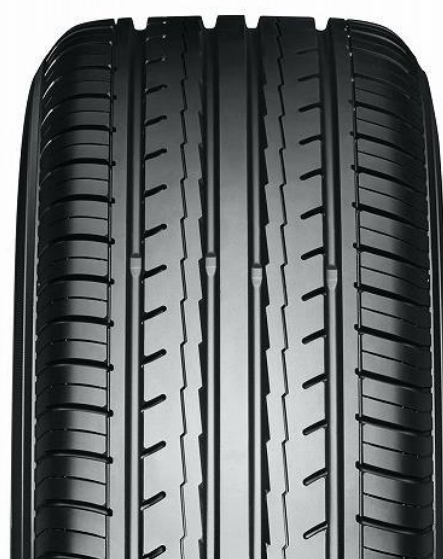
ES32A Ширина: 225 и больше