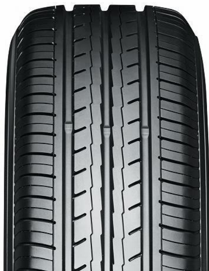
ES32 Ширина: 145-215